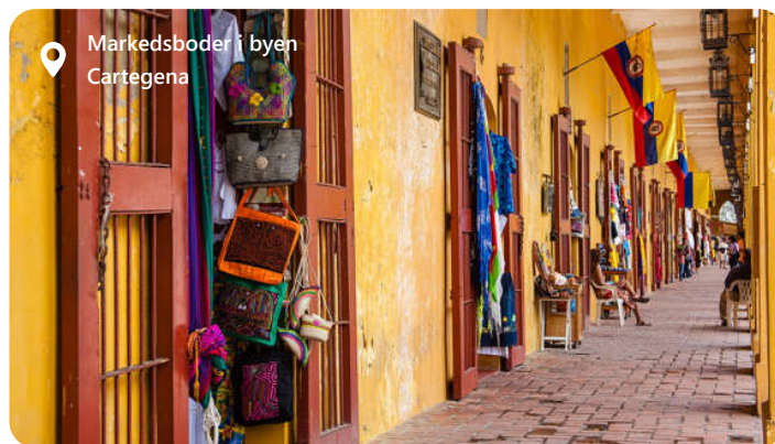
Markedsboder i byen Cartagena

Cartagena de Indias er en unik by fyldt med historie, kultur og skønhed. Udforsk dens gader, nyt den lokale mad og tag dig tid til at lære om dens fascinerende historie for at få det mest mulige ud af dit besøg.