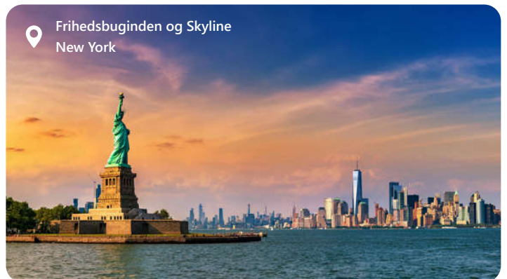
Frihedsgudinden og Skyline New York

New York City, også kendt som "The Big Apple," er en verdensberømt metropol, der symboliserer pulserende energi, kulturel mangfoldighed og utallige muligheder. Beliggende i den nordøstlige del af USA, er byen en sand smeltedigel af kulturer, og dens ikoniske vartegn som Empire State Building, Central Park og Frihedsgudinden trækker besøgende fra hele verden. New York er hjemsted for utallige museer, teatre og gourmetrestauranter samt en af de mest indflydelsesrige økonomiske og finansielle centre globalt. Det er et sted, der aldrig sover, og som aldrig holder op med at overraske og inspirere.