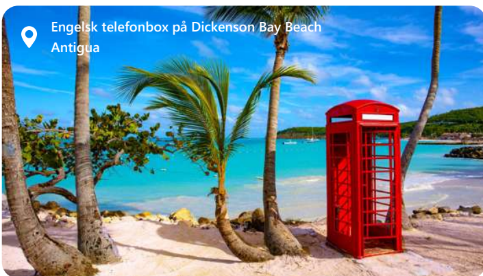
Engelsk telefonbox på Dickenson Bay Beach Antigua

Antigua er en perle i det caribiske øhav, der byder velkommen med en udsøgt caribiske charme. Med sine blændende hvide sandstrande, turkise farvande og frodige landskaber danner St. John rammen om et malerisk paradys. Denne idylliske destination lokker med en afslappet atmosfære, historiske seværdigheder og et væld af udendørs aktiviteter. Udforsk de farverige bygninger, nyd det lokale køkken og fordyb dig i den varme gæstfrihed, der definerer Antigua som en destination, hvor det caribiske liv kan opleves til fulde.