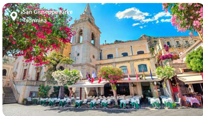
San Giuseppe Kirke Taormina

Messina, en charmerende by på Sicilien, Italien, imponerer besøgende med sin rige kulturarv og naturskønhed. Byen er kendt for sin imponerende arkitektur og enestående udsigt over Middelhavet. Udforsk lokale seværdigheder som Messina Katedralen og Fontana di Orione og nyd autentisk siciliansk køkken med delikatesser som arancini og cannoli. Messina tilbyder en harmonisk blanding af historie og skønhed.