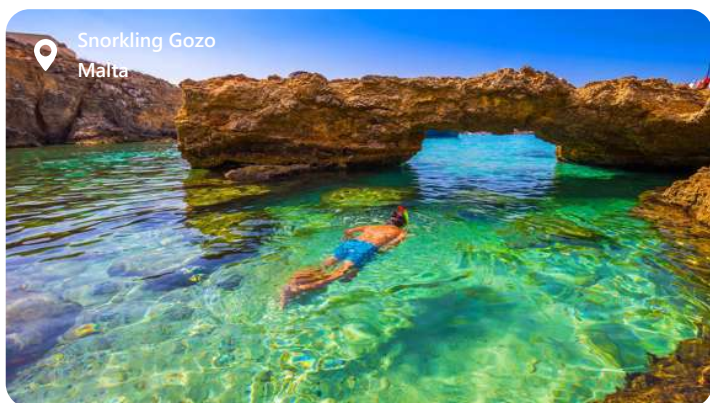
Snorkling Gozo Malta