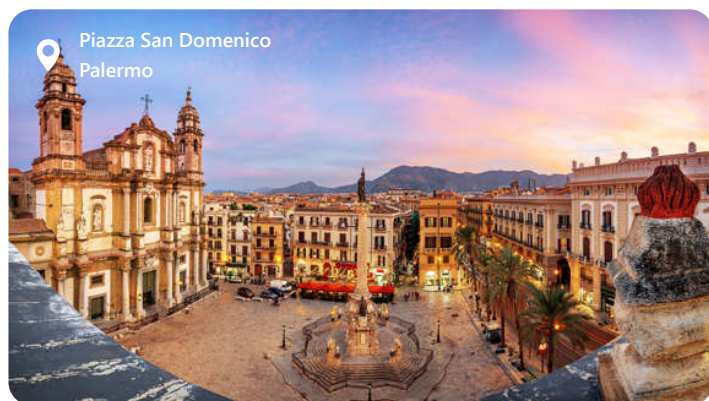
Piazza San Domenico Palermo

Palermo ligger i hjertet af Sicilien, der byder besøgende velkommen med sin unikke blanding af kultur, historie og skønhed. Denne fortryllende by ved Middelhavet er berømt for sin imponerende arkitektur, herunder normanniske domkirker og barokke paladser, der vidner om dens rige fortid. Palermo er også en kulinarisk oplevelse med sin udsøgte gadekøkken og markeder fyldt med friske råvarer. Byens gader er farverige, kaotiske og fyldt med historie, hvilket gør det til et spændende rejsemål for dem, der ønsker at udforske Siciliens kulturelle arv og nyde den varme og gæstfrie atmosfære.