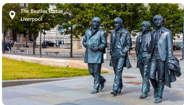
The Beatles statue Liverpool