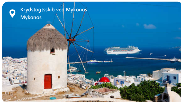
Krydstogtskib ved Mykonos Mykonos

Mykonos, perlen i Det Ægæiske Hav, byder besøgende velkommen med sit maleriske ø-landskab og krystallklare farvande. Denne græske ø er kendt for sine charmerende hvide bygninger med blå kupler, snoede gader og livlige natteliv. Udforsk lokale seværdigheder som det ikoniske Petros of Mykonos og vindmøllerne i Mykonos Town. Nyd autentisk græsk mad med retter som moussaka og souvlaki. Mykonos inviterer dig til at fordype dig i det græske ø-liv og nyde paradiset ved Det Ægæiske Hav.