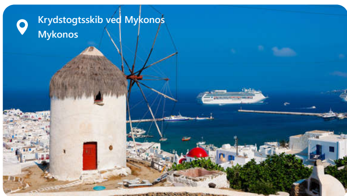
Krydstogtskib ved Mykonos Mykonos