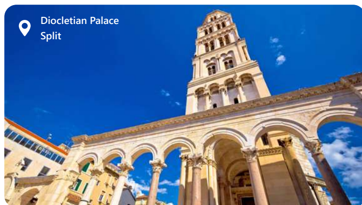
Diocletian Palace Split

Split, er en pragtfuld kroatisk by ved Adriaterhavet og den næststørste by i Kroatien. Med sin rigdom af historie og kultur er Split et fascinerende sted at udforske. Byen er berømt for Diocletians Palads, der stammer tilbage til det 4. århundrede, og som nu er en del af UNESCOs verdensarvliste. Ud over sin historiske betydning byder Split på smukke strande, livlige markeder og en mangfoldig gastronomisk scene. Gå gennem de smalle brostensbelagte gader, udforsk de gamle bymure og nyd den lokale gæstfrihed, der gør Split til et skønt rejsemål ved Adriaterhavet.