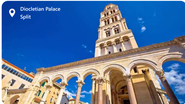
Diocletian Palace Split

Split, er en pragtfuld kroatisk by ved Adriaterhavet og den næststørste by i Kroatien. Med sin rigdom af historie og kultur er Split et fascinerende sted at udforske. Byen er berømt for Diocletians Palads, der stammer tilbage til det 4. århundrede, og som nu er en del af UNESCOs verdensarvliste. Ud over sin historiske betydning byder Split på smukke strande, livlige markeder og en mangfoldig gastronomisk scene. Gå gennem de smalle brostensbelagte gader, udforsk de gamle bymure og nyd den lokale gæstfrihed, der gør Split til et skønt rejssemål ved Adriaterhavet.