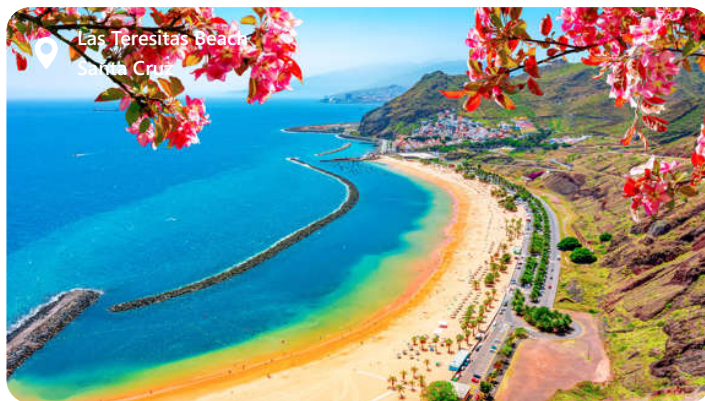
Las Teresitas Beach Santa Cruz

Tenerife er den største af De Kanariske Øer og en skat i Atlanterhavet, som byder besøgende velkommen med en betagende skønhed og en mangfoldig kultur. Øen er kendt for sin dramatiske vulkanske landskab, herunder den majestætiske Teide-vulkan, Spaniens højeste bjerg. Tenerife tilbyder solbeskinnede strande, livlige feriesteder og charmerende, historiske byer som La Laguna. Hovedstaden Santa Cruz, og det frodige Orotava-dal tilføjer til øens appel. Med sin blanding af natur, kultur og afslapning er Tenerife en destination, der appellerer til enhver rejsendes smag.