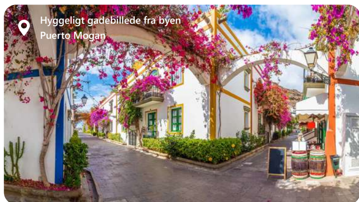
Hyggeligt gadebillede fra byen Puerto Mogan