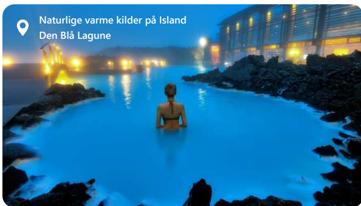
Naturlige varme kilder på Island Den Blå Laguna

Reykjavik, Islands hovedstad, byder dig velkommen til en verden af naturskønhed og kulturel rigdom. Byen er omgivet af majestætiske bjerge, geotermiske varme kilder og det vilde Atlanterhav. Oplev bl.a. den Blå Laguna - en fantastisk oplevelse. Udforsk den fascinerende islandske kultur på museer og gallerier, nyd lokale delikatesser som skaldyr og få en smagsprøve på det pulserende natteliv. Reykjavik er et ideelt udgangspunkt for eventyr i Islands utrolige landskaber. Oplev de storslåede gejsere, vandfald og gletsjere, der gør Island til et unikt rejsemål.