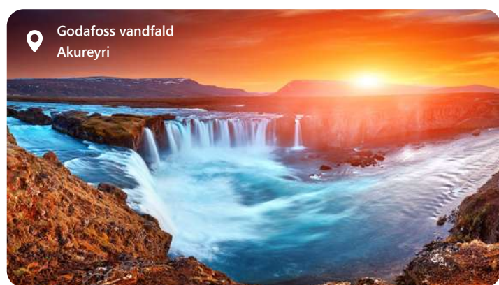
Godafoss vandfald Akureyri