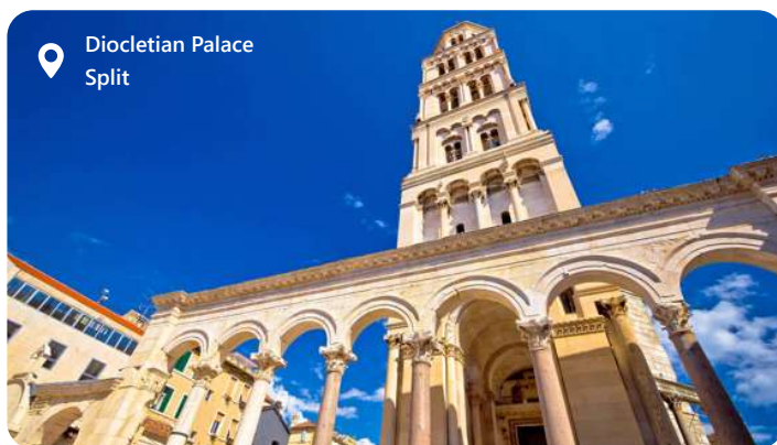
Diocletian Palace Split

Split, er en pragtfuld kroatisk by ved Adriaterhavet og den næststørste by i Kroatien. Med sin rigdom af historie og kultur er Split et fascinerende sted at udforske. Byen er berømt for Diocletians Palads, der stammer tilbage til det 4. århundrede, og som nu er en del af UNESCOs verdensarvliste. Ud over sin historiske betydning byder Split på smukke strande, livlige markeder og en mangfoldig gastronomisk scene. Gå gennem de smalle brostensbelagte gader, udforsk de gamle bymure og nyd den lokale gæstfrihed, der gør Split til et skønt rejsemål ved Adriaterhavet.