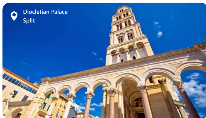
Diocletian Palace Split

Split, er en pragtfuld kroatisk by ved Adriaterhavet og den næststørste by i Kroatien. Med sin rigdom af historie og kultur er Split et fascinerende sted at udforske. Byen er berømt for Diocletians Palads, der stammer tilbage til det 4. århundrede, og som nu er en del af UNESCOs verdensarvliste. Ud over sin historiske betydning byder Split på smukke strande, livlige markeder og en mangfoldig gastronomisk scene. Gå gennem de smalle brostensbelagte gader, udforsk de gamle bymure og nyd den lokale gæstfrihed, der gør Split til et skønt rejsemål ved Adriaterhavet.