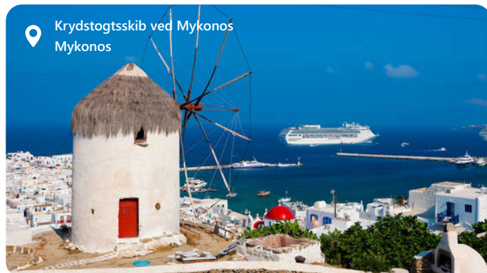
Krydstogtskib ved Mykonos Mykonos

Mykonos, perlen i Det Ægæiske Hav, byder besøgende velkommen med sit maleriske ø-landskab og krystalklare farvande. Denne græske ø er kendt for sine charmerende hvide bygninger med blå kupler, snoede gader og livlige natteliv. Udforsk lokale seværdigheder som det ikoniske Petros of Mykonos og vindmøllerne i Mykonos Town. Nyd autentisk græsk mad med retter som moussaka og souvlaki. Mykonos inviterer dig til at fordype dig i det græske ø-liv og nyde paradiset ved Det Ægæiske Hav.