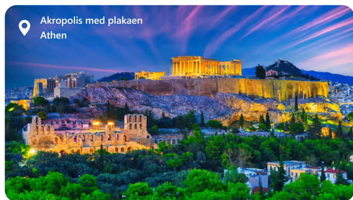
Akropolis med plakaen Athen