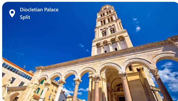
Diocletian Palace Split

Split, er en pragtfuld kroatisk by ved Adriaterhavet og den næststørste by i Kroatien. Med sin rigdom af historie og kultur er Split et fascinerende sted at udforske. Byen er berømt for Diocletians Palads, der stammer tilbage til det 4. århundrede, og som nu er en del af UNESCOs verdensarvliste. Ud over sin historiske betydning byder Split på smukke strande, livlige markeder og en mangfoldig gastronomisk scene. Gå gennem de smalle brostensbelagte gader, udforsk de gamle bymure og nyd den lokale gæstfrihed, der gør Split til et skønt rejsemål ved Adriaterhavet.