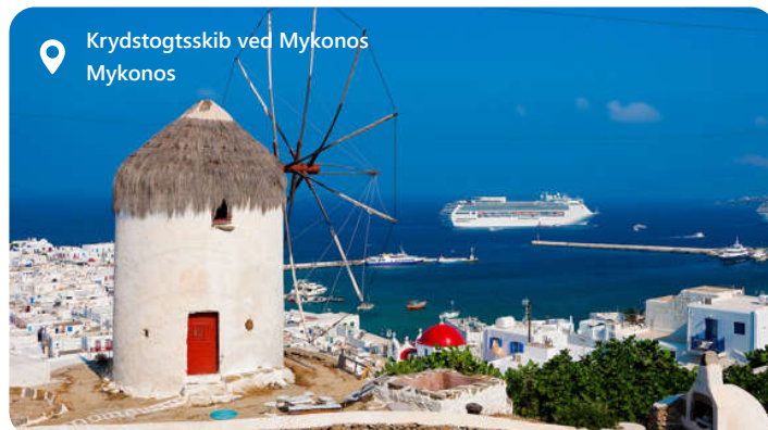
Krydstogtskib ved Mykonos Mykonos

Mykonos, perlen i Det Ægæiske Hav, byder besøgende velkommen med sit maleriske ø-landskab og krystalklare farvande. Denne græske ø er kendt for sine charmerende hvide bygninger med blå kupler, snoede gader og livlige natteliv. Udforsk lokale seværdigheder som det ikoniske Petros of Mykonos og vindmøllerne i Mykonos Town. Nyd autentisk græsk mad med retter som moussaka og souvlaki. Mykonos inviterer dig til at fordype dig i det græske ø-liv og nyde paradiset ved Det Ægæiske Hav.