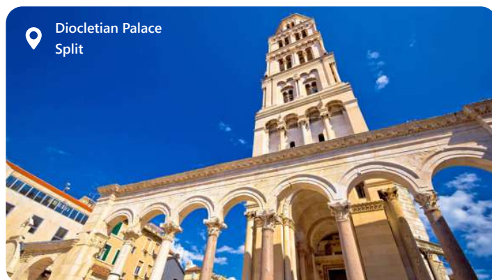
Diocletian Palace Split

Split, er en pragtfuld kroatisk by ved Adriaterhavet og den næststørste by i Kroatien. Med sin rigdom af historie og kultur er Split et fascinerende sted at udforske. Byen er berømt for Diocletians Palads, der stammer tilbage til det 4. århundrede, og som nu er en del af UNESCOs verdensarvliste. Ud over sin historiske betydning byder Split på smukke strande, livlige markeder og en mangfoldig gastronomisk scene. Gå gennem de smalle brostensbelagte gader, udforsk de gamle bymure og nyd den lokale gæstfrihed, der gør Split til et skønt rejssemål ved Adriaterhavet.