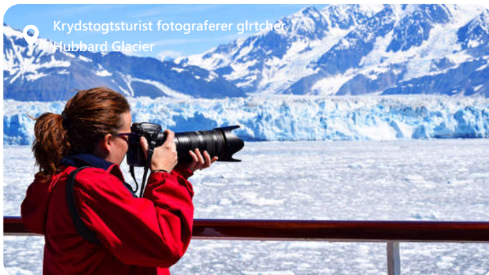
Krydstogtsturist fotograferer gletcher Hubbard Glacier