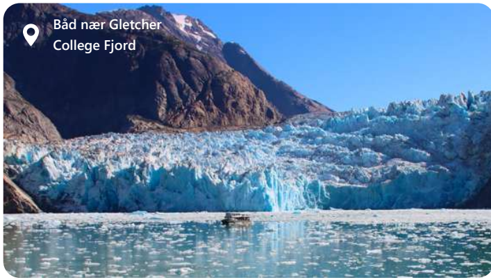
Båd nær Gletcher College Fjord