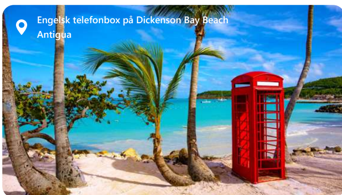
Engelsk telefonbox på Dickenson Bay Beach Antigua

and sugar cane plantations. Centuries of French rule don't seem to have influenced the locals' philosophy too much: "it's better to avoid something than to face something".