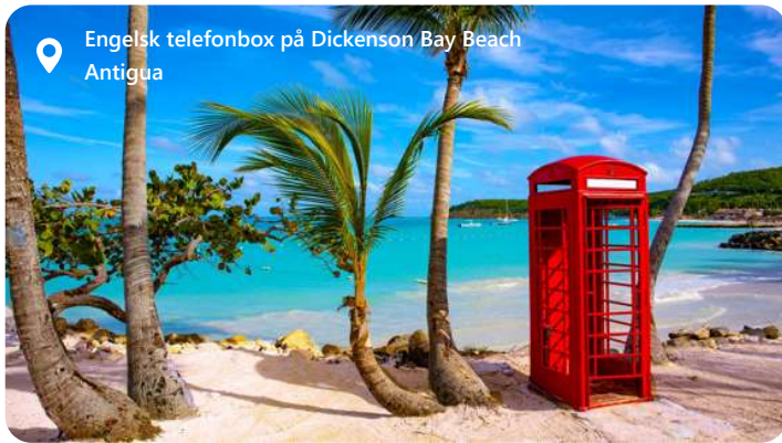
Engelsk telefonbox på Dickenson Bay Beach Antigua