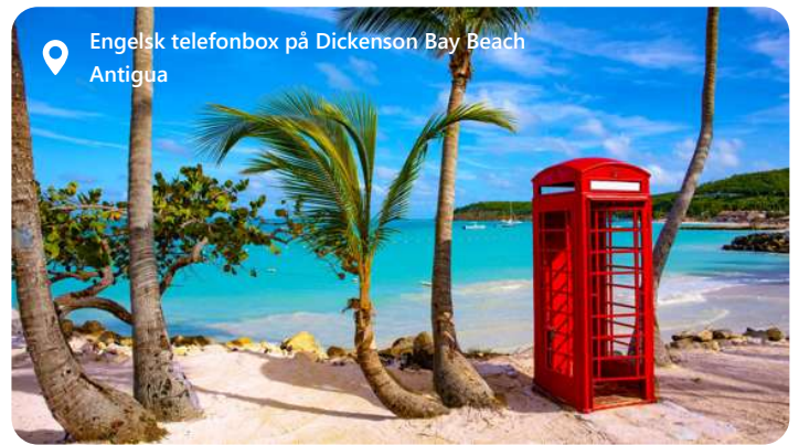
Engelsk telefonbox på Dickenson Bay Beach Antigua

Antigua er en perle i det caribiske øhav, der byder velkommen med en udsøgt caribiske charme. Med sine blændende hvide sandstrande, turkise farvande og frodige landskaber danner St. John rammen om et malerisk paradis. Denne idylliske destination lokker med en afslappet atmosfære, historiske seværdigheder og et væld af udendørs aktiviteter. Udforsk de farverige bygninger, nyd det lokale køkken og fordyb dig i den varme gæstfrihed, der definerer Antigua som en destination, hvor det caribiske liv kan opleves til fulde.