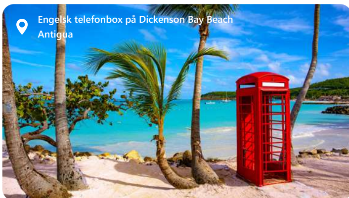
Engelsk telefonbox på Dickenson Bay Beach Antigua

and sugar cane plantations. Centuries of French rule don't seem to have influenced the locals' philosophy too much: "it's better to avoid something than to face something".