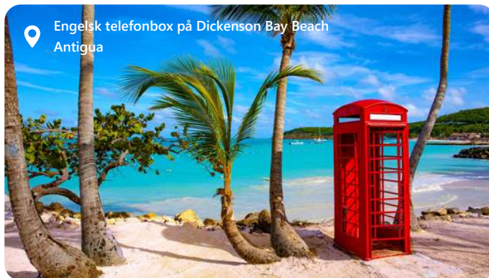
Engelsk telefonbox på Dickenson Bay Beach Antigua

Antigua er en perle i det caribiske øhav, der byder velkommen med en udsøgt caribiske charme. Med sine blændende hvide sandstrande, turkise farvande og frodige landskaber danner St. John rammen om et malerisk paradis. Denne idylliske destination lokker med en afslappet atmosfære, historiske seværdigheder og et væld af udendørs aktiviteter. Udforsk de farverige bygninger, nyd det lokale køkken og fordyb dig i den varme gæstfrihed, der definerer Antigua som en destination, hvor det caribiske liv kan opleves til fulde.