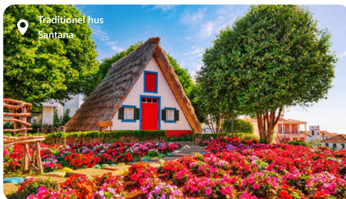
Traditionel hus Santana

Madeira er et naturparadis af blomstrende haver, dramatiske bjerglandskaber og imponerende kyststrækninger. Besøgende kan udforske den farverige hovedstad Funchal, vandre ad levadastierne langs bjergsiderne og nyde udsigten fra Cabo Girão, Europas højeste klippeudsigt. Besøgende kan også udforske de spektakulære omgivelser, herunder bjergene og Levada-vandingskanalerne, der er ideelle til vandreture og naturoplevelser. Funchal er en ægte juvel på Madeira, hvor natur og kultur mødes harmonisk.