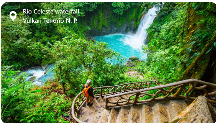
Rio Celeste waterfall Vulkan Tenorio N. P.

last century's greatest engineering achievement... along with its surrounding lush, verdant lands. This testament to human audacity joins the Pacific and Caribbean in the most direct way possible, and is worth making a leisurely part of your vacation.