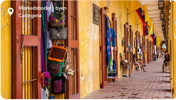
Markedsboder i byen Cartagena

Cartagena de Indias er en smuk by beliggende på den caribiske kyst i Colombia. Byen er kendt for sine imponerende bymure "Las Murallas," der blev bygget for at beskytte mod pirater. Disse mure er stadig i stor grad intakte og er et vartegn for Cartagena. Den har en rig kulturel arv med store påvirkninger fra indfødte folk, afrikanske slaver og europæiske kolonister. Dette har resulteret i en skøn unik blanding af musik, dans og gastronomi. Cartagena er en farverig by med nogle smukke strande langs den caribiske kyst, herunder Bocagrande og Playa Blanca. Disse strande er ideelle til afslapning, svømning og vandsport. Cartagena de Indias er en unik by fyldt med historie, kultur og skønhed. Udforsk dens gader, nyt den lokale mad og tag dig tid til at lære om dens fascinerende historie for at få det mest mulige ud af dit besøg.