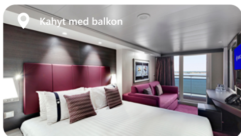
Kahyt med balkon

OB - Udvendig Bella, Uspecificeret OL2 - Udvendig Fantastica, Premium OM2 - Udvendig Fantastica, junior OO - Udvendig Fantastica, med begrænset udsigt OR1 - Udvendig Fantastica, Deluxe