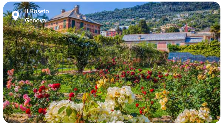
Il Roseto Genova

Genoa er beliggende ved den maleriske Liguriske havkyst i Italien, er en by med en fascinerende historie og kulturel rigdom. Dens gamle havn, en af Middelhavets største, har tjent som et vigtigt knudepunkt for handel i århundreder. Byen er kendt for sin charmerende gamle bydel med smalle brostensbelagte gader, farverige bygninger og imponerende paladser. Genoa er også fødestedet for opdagelsesrejsende Christopher Columbus og byder på et væld af museer, kunstgallerier og en levende kulinarisk scene med lækker ligurisk mad. Med sin unikke blanding af historie, kultur og skønhed er Genoa en uimodståelig destination i Italien.