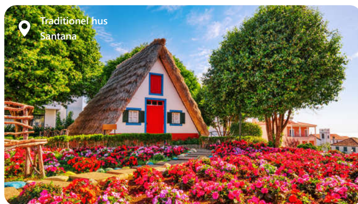
Traditionel hus Santana

Madeira er et naturparadis af blomstrende haver, dramatiske bjerglandskaber og imponerende kyststrækninger. Besøgende kan udforske den farverige hovedstad Funchal, vandre ad levadastierne langs bjergsiderne og nyde udsigten fra Cabo Girão, Europas højeste klippeudsigt. Besøgende kan også udforske de spektakulære omgivelser, herunder bjergene og Levada-vandingskanalerne, der er ideelle til vandreture og naturoplevelser. Funchal er en ægte juvel på Madeira, hvor natur og kultur mødes harmonisk.