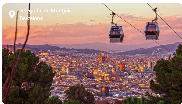
Telegrafic de Montjuic Barcelona

Barcelona - en charmerende metropol og hovedstad i det katalanske Nordspanien. Byen er en sand perle hvor historie og nutid forenes i perfekt harmoni. Særligt Gaudís fascinerende mesterværker som La Sagrada Família og Park Güell, tager enhver med storm. Byen stråler af kulturel rigdom med kunstgallerier, museer og et livligt gademiljø. De gyldne sandstrande langs kysten og den fortryllende gotiske kvarter skaber en atmosfære, der indfanger hjertet og sindet. Barcelona er ikke blot en by, det er en oplevelse.