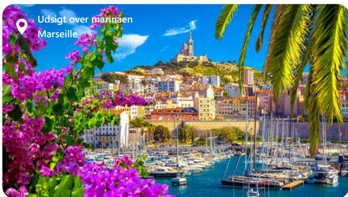
Udsigt over marinaen Marseille