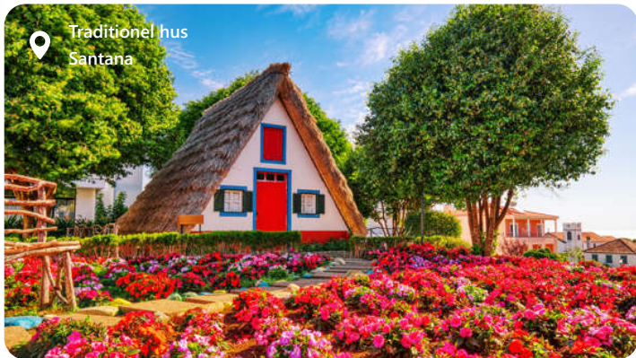
Traditionel hus Santana