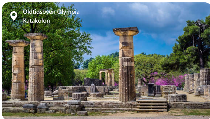
Oldtidsbyen Olympia Katakolon

Byen er en harmonisk blanding af kultur og naturskønhed og er ideel for dem, der ønsker at udforske den smukke vestlige kyst i Grækenland.