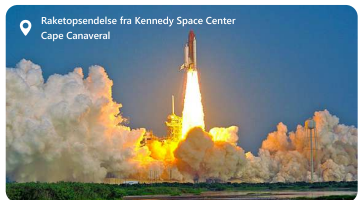
Raketopsendelse fra Kennedy Space Center Cape Canaveral

Port Canaveral summer af solskin, strandliv og eventyr - og lige i nærheden venter nogle af Floridas mest ikoniske oplevelser. Mod syd rejser Kennedy Space Center sig som et monument over rumfartens historie, hvor du kan stå i skyggen af de enorme Saturn V-raketter, gå gennem interaktive udstillinger og mærke spændingen fra en tid, hvor mennesket tog de første skridt mod månen. Lidt længere mod vest lokker Orlando med sine verdensberømte forlystelsesparker, mens kysten omkring Port Canaveral selv byder på afslappet charme. Cocoa Beach er kendt som Floridas surfhovedstad - her trækker surfere deres brætter gennem de lune bølger, og på den lange pier kan du nyde friskfangede rejer eller en skål clam chowder med udsigt over havet. Naturreservaterne i området giver mulighed for at se delfiner, søkøer og havskildpadder i deres naturlige omgivelser, mens Cape Canaveral Lighthouse står som et fast pejlemærke langs den gyldne kyst. Port Canaveral forener teknologi, natur og kyststemning i en dag, der både kan være afslappet og fuld af oplevelser.