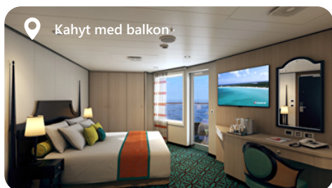
Kahyt med balkon

4J - Familie Harbor Deluxe Havudsigt 6A - Havudsigt 6B - Havudsigt 6L - Deluxe Havudsigt 6M - Deluxe Havudsigt 6S - Spa Havudsigt (Begrænset Udsigt) 6T - Spa Havudsigt (Begrænset udsigt) FE - Familie Harbor Havudsigt (Begrænset Udsigt) FJ - Familie Harbor Deluxe Havudsigt HE - Havana Cabana OV - Garanti Havudsigt PT - Køje