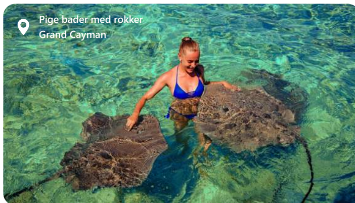
Pige bader med røkker Grand Cayman

Grand Cayman er den største ø i Cayman Islands, er en tropisk juvel i Caribien. Med sit turkisblå hav, hvide sandstrande og en blomstrende koralrev, tiltrækker øen eventyrlystne rejsende og strandentusiaster fra hele verden. Udover den naturskønne skønhed byder Grand Cayman også på en levende kulturscene, udsøgt mad og en skattefri shoppingoplevelse. Dybhavsdykning, snorkling ved Stingray City og udforskning af huler er blot nogle af de utallige aktiviteter, du kan nyde her. Med sin afslappede atmosfære og luksuriøse resorts er Grand Cayman en destination, der inviterer til afslapning og eventyr.