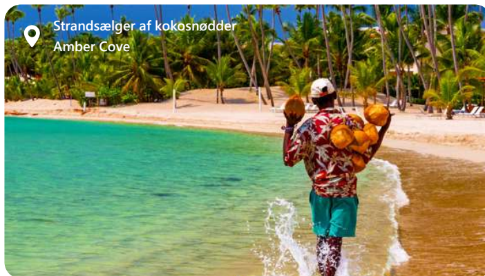
Strandsælger af kokosnødder Amber Cove

Amber Cove er en strålende perle beliggende på den nordlige kyst af Den Dominikanske Republik, tæt på byen Puerto Plata. Denne moderne krydstogthavn, som åbnede i 2015, er udviklet af Carnival Corporation og har hurtigt etableret sig som et af Caribiens mest populære rejsemål for krydstogtspassagerer. Med sin betagende naturlige skønhed, rige kulturhistorie og en bred vifte af aktiviteter er Amber Cove et ideelt sted for en uforglemmelig ferieoplevelse.