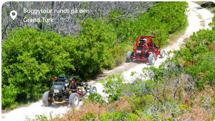
Buggytour rundt på øen Grand Turk