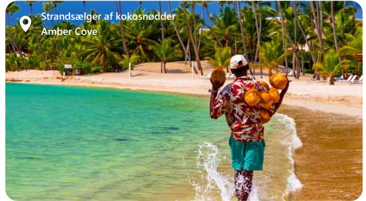
Strandsælger af kokosnødder Amber Cove

Amber Cove er en strålende perle beliggende på den nordlige kyst af Den Dominikanske Republik, tæt på byen Puerto Plata. Denne moderne krydstogthavn, som åbnede i 2015, er udviklet af Carnival Corporation og har hurtigt etableret sig som et af Caribiens mest populære rejsemål for krydstogtspassagerer. Med sin betagende naturlige skønhed, rige kulturhistorie og en bred vifte af aktiviteter er Amber Cove et ideelt sted for en uforglemmelig ferieoplevelse.