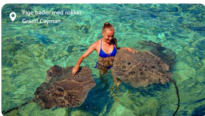
Pige bader med rokker Grand Cayman