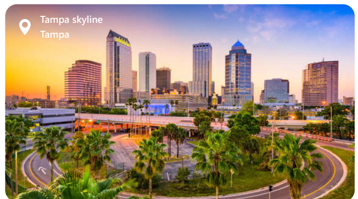
Tampa skyline Tampa

Tampa som er en perle på Floridas vestkyst, er en by fyldt med liv, kultur og historie. Beliggende ved Tampa Bay, byder denne metropol besøgende velkommen med sin varme atmosfære og mangfoldige tilbud. Uanset om man er interesseret i historie, kunst, mad eller sport, er der noget for enhver smag i denne dynamiske by ved Tampa Bay.