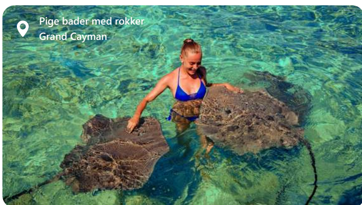
Pige bader med rokker Grand Cayman