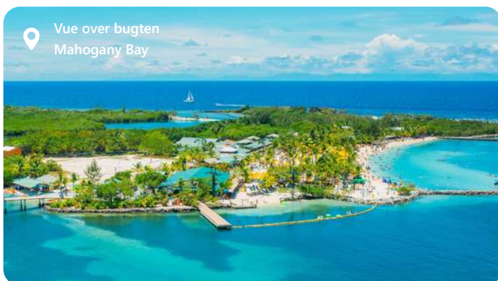
Vue over bugten Mahogany Bay