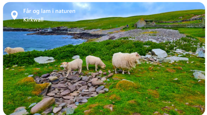
Får og lam i naturen Kirkwall

Udforsk de lokale kulturelle skatte som Orkney Museum og Ring of Brodgar, og dyk ned i øens unikke historie. Kirkwall byder også på kulinariske oplevelser med friskfanget fisk og lokale delikatesser. Byen er en harmonisk blanding af historie og naturskønhed, hvilket gør den til en ideel destination for dem, der ønsker at udforske Orkney-øernes unikke kulturarv og betagende landskab.