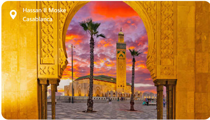
Hassan II Moske Casablanca