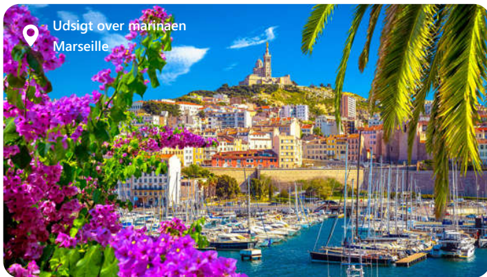
Udsigt over marinaen Marseille