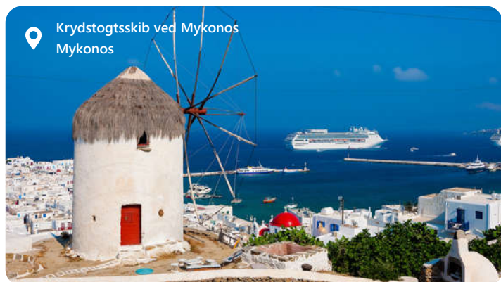
Krydstogtsskib ved Mykonos Mykonos