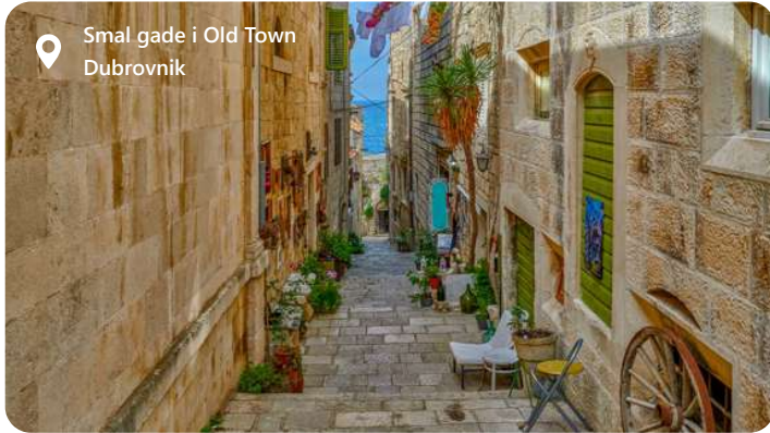
Smal gade i Old Town Dubrovnik