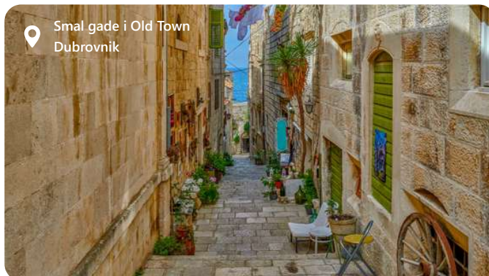
Smal gade i Old Town Dubrovnik

Dubrovnik, den perle ved Adriaterhavet, byder på enestående skønhed og historisk charme. De velbevarede bymure og de imponerende gamle bygninger vidner om en rik fortid som handels- og søfartsby. Byens strålende blå hav og middelhavsklima gør det til et drømmested for besøgende. Udforsk de snoede gader, beundr de majestætiske fæstningsværker og nyd det lokale køkken og gæstfrihed. Dubrovnik er en by hvor historie og naturskønhed forenes i en unik oplevelse.