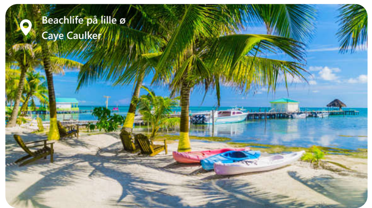
Beachlife på lille ø Caye Caulker

Hovedstaden Belize er ofte et lidt rodet bekendtskab. Byen er ikke så spændende, men man skal ikke langt fra havnen før det ser helt anderledes ud. Her er Belize kendt for sin naturskønhed og forskelligartede økosystemer. Landets kystlinje langs Caribien er hjemsted for regnskove, mangroveskove, koraller og kalkstensgrotter. Der er en mangfoldig kultur, som afspejles i landets musik, dans, mad og kunst. En halv times sejlads fra centrum ligger paradiset i bogstaveligste forstand. Tag både og nyd dage på Caye Caulker hvis du er til sol og hygge med billig mad og kulørte drinks.