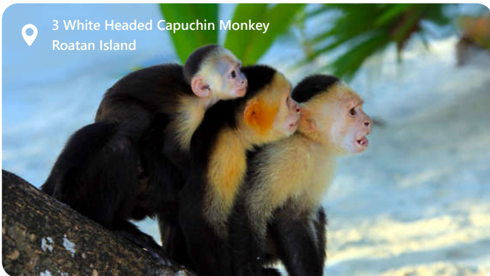
3 White Headed Capuchin Monkey Roatan Island