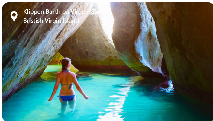
Klippen Barth på Virgin Gorda British Virgin Island

Tortola, der er den største ø af 4 øer i De Britiske Jomfruøer En skat i Det Caribiske Hav. Disse solfyldte øer byder dig velkommen med sin blændende skønhed, hvide sandstrande og krystalklart hav. Tortola er kendt for sine maleriske ankerpladser og fantastiske udsigtspunkter som Skyworld og Sage Mountain. Virgin Gorda er den mest populære med Devils N.P og The Barth. Øerne er et paradis for sejlere og dykkere og tilbyder en kultur med farverige markeder og en kulinarisk mangfoldighed. Her smelter afslapning og eventyr sammen, så det caribiske ø-liv kan nydes i sin fulde pragt.