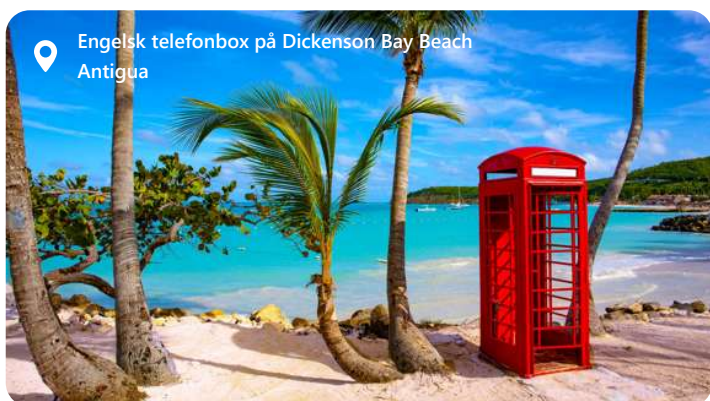
Engelsk telefonbox på Dickenson Bay Beach Antigua