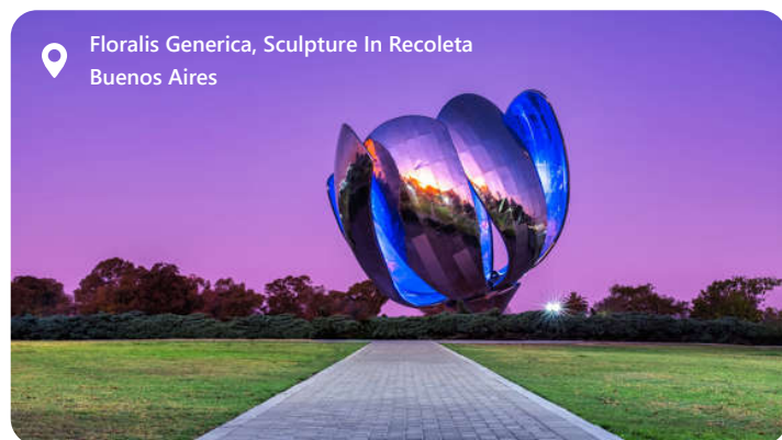
Floralis Genérica, Sculpture In Recoleta Buenos Aires