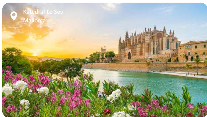
Katedral Le Seu Mallorca