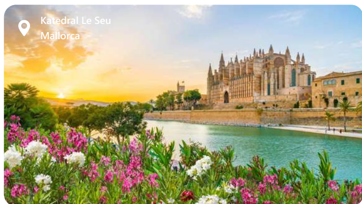
Katedral Le Seu Mallorca