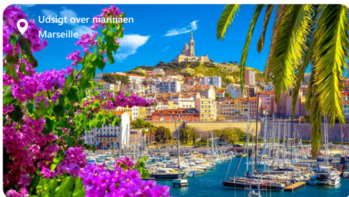
Udsigt over marinaen Marseille