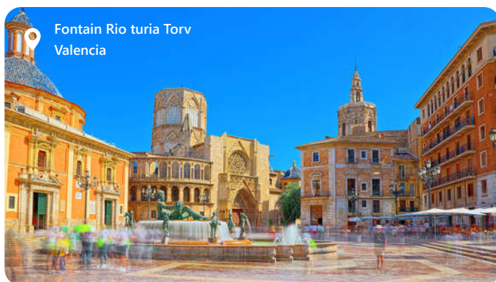
Fontain Rio turia Torv Valencia

Valencia er en smuk region beliggende på den østlige kyst af Spanien, er en skatkiste af historie, kultur og naturskønhed. Med sin fascinerende blanding af middelalderlige monumenter, moderne arkitektur og strålende strande er Valencia en magnet for rejsende fra hele verden. Hjemsted for den berømte paella-ret, byder regionen på en udsøgt kulinarisk oplevelse. Den årlige Las Fallas-festival er et imponerende skue med farverige optog og spektakulære fyrværkeri. Valencia er også kendt for sin arkitektoniske perle, City of Arts and Sciences. Dette sted er et paradys for kunst- og videnskabsentusiaster. Valencia er kort sagt en destination, der fusionerer fortidens pragt med nutidens dynamik og naturens skønhed.