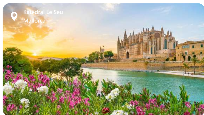
Katedral Le Seu Mallorca