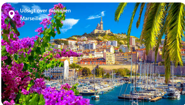
Udsigt over marinaen Marseille