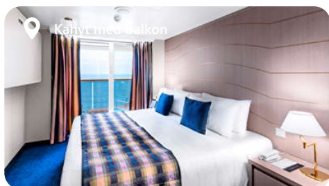
Kahyt med balkon