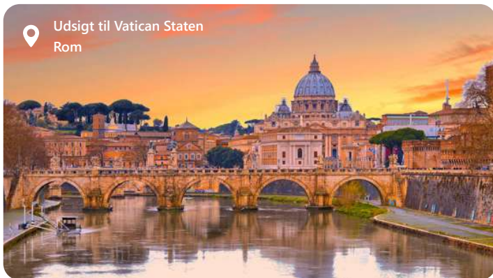
Udsigt til Vatican Staten Rom