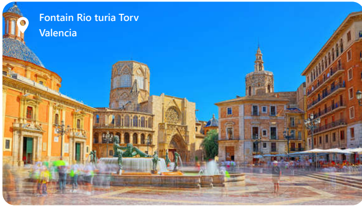
Fontain Rio turia Torv Valencia